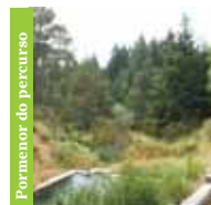
Pormenor do percurso