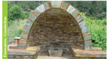
Fontanário - Coanheiras