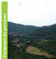
Pormenor do percurso