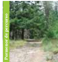
Pormenor de percurso