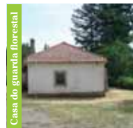
Casa do guarda florestal