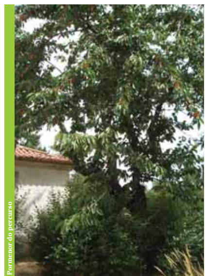
Pormenor do percurso

A Rota da Azinha possibilita uma visita à antiga casa do Guarda-Florestal do Gorgulhão – as casas de Guarda-Florestal foram implantadas de forma a dotar os Perímetros Florestais e respectivas unidades de gestão, de infra-estruturas de apoio à actividade florestal ali desenvolvida, permitindo a fixação de Guardas-Florestais e respectivas famílias que teriam por incumbência a vigilância e fiscalização das áreas que lhe estavam atribuídas. Os Guardas-Florestais desempenharam um papel fulcral na arborização e protecção destes Perímetros Florestais que ocupam grande parte da Serra. O Gorgulhão é ainda constituído por uma área de lazer que inclui um circuito de manutenção, percurso de BTT e um parque de merendas rodeado por densas matas de resinosas.