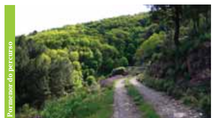
Pormenor do percurso