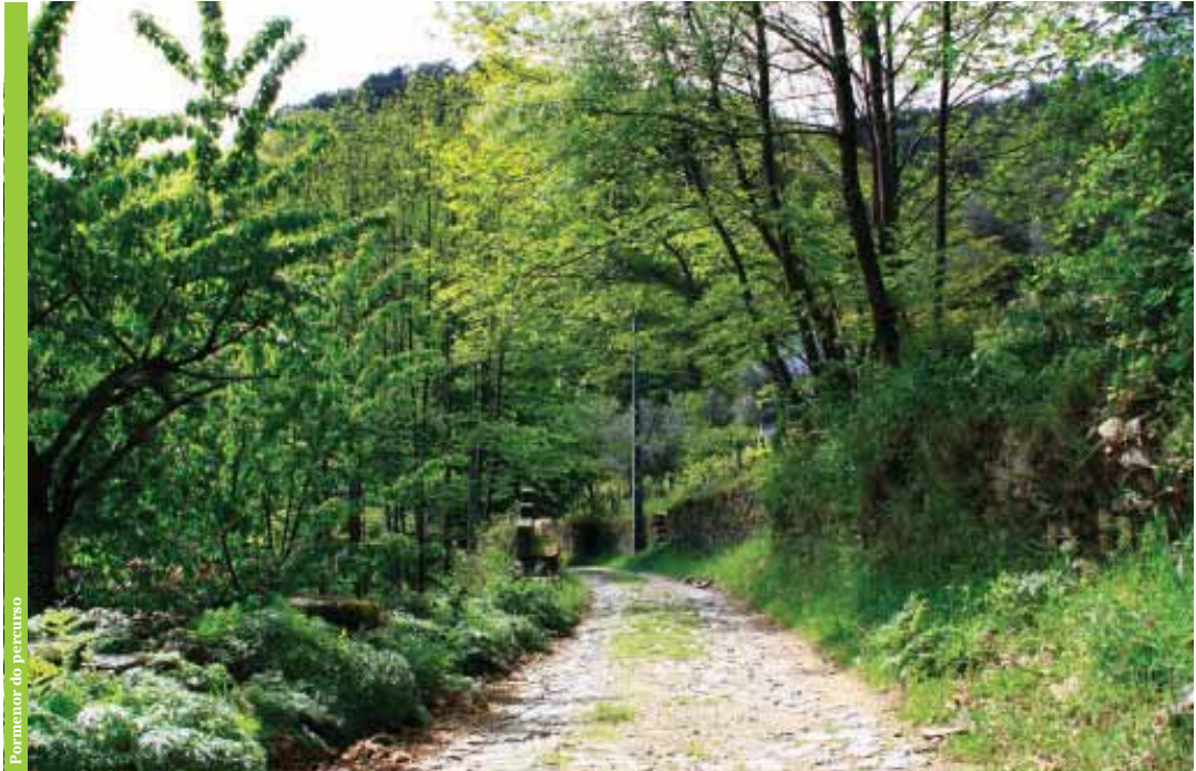
Pormenor do percurso

A paisagem natural é marcada pela floresta mista, de folhosas e resinosas, que pode ser observada ao longo de grande parte da rota. Na derivação que liga Sameiro a Manteigas, destaca-se o Cabeço de Satanás de onde é possível desfrutar de uma paisagem abrangente e fascinante sobre os bosques que envolvem o vale do Zêzere. Percorrer a Rota do Sol é ainda uma oportunidade de observar as variadas matizes que se vão sucedendo ao longo das estações do ano.