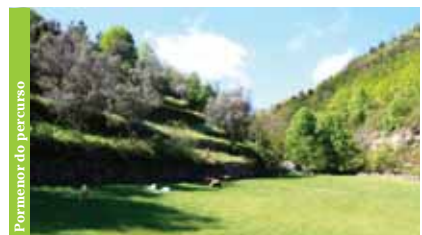
Pormenor do percurso