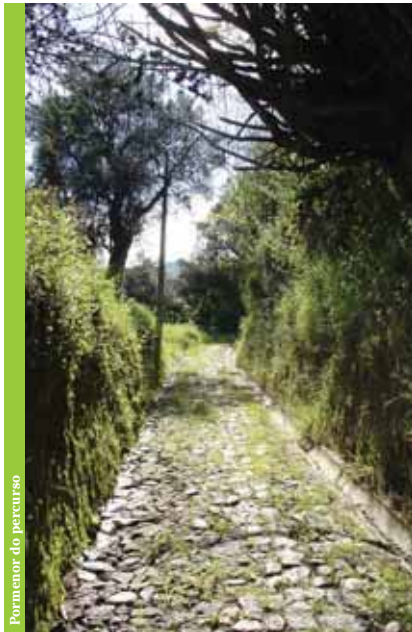
Parque do percurso