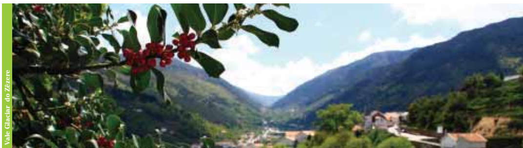
Vale Glaciar do Zêzere

A maior altitude, a abrangência visual evidencia belíssimas panorâmicas sobre o Vale Glaciar do Zêzere e sobre galerias ripícolas compostas, que reflectem o verde intenso das montanhas que as rodeiam, sem esquecer a curiosa marca que as cascalheiras imprimem no cenário.