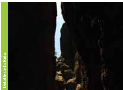
Detalle de la Ruta