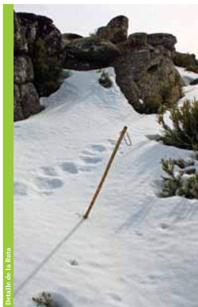
Detalle de la Ruta