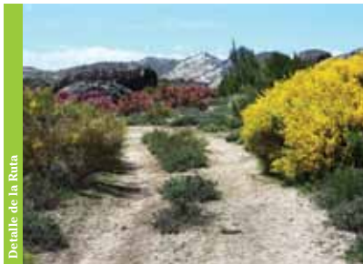
Detalle de la Ruta