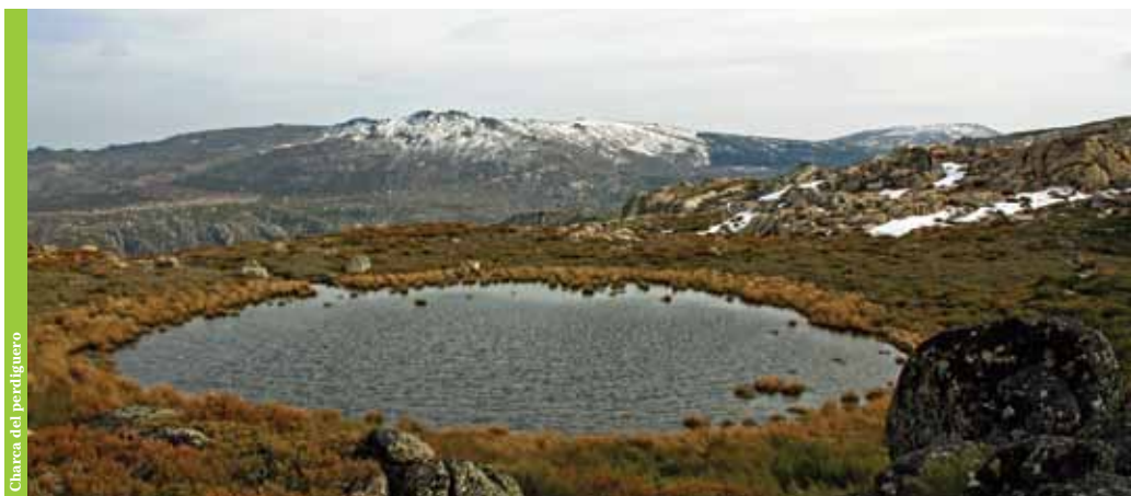
Charca del perúguero