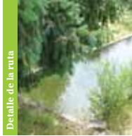
Detalle de la ruta