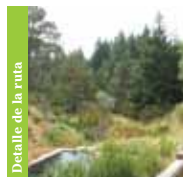
Detalle de la ruta