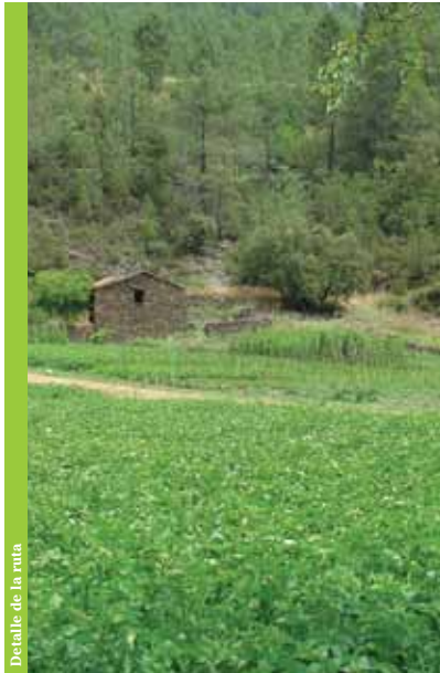
Detalle de la ruta

Para los amantes de caminar, la Ruta de la Encina es particularmente atractiva, posibilitando diversidad y profundidad de planos visuales consecutivos, conferidos por la altitud y el perfil transversal de los valles e sus graciosas cumbres. La multiplicidad de formas, texturas y movimiento del relevo, se asocia una vegetación rica y diversa.