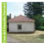
Casa del Guardia Forestal