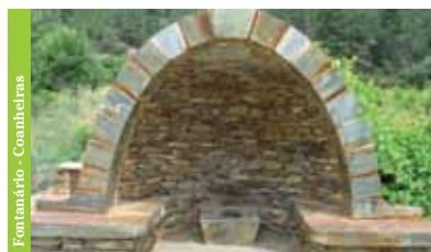
Fontanário - Coanheiras