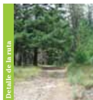
Detalle de la ruta

Es de mencionar que la Ruta de la Encina permite una interacción con la Ruta del Valle de la Amoreira , Ruta del Corredor de los Moros y Ruta del Sameiro .