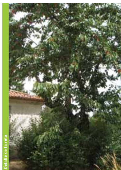
Detalle de la ruta