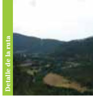
Detalle de la ruta