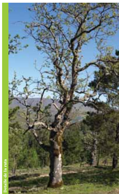
Detalle de la ruta