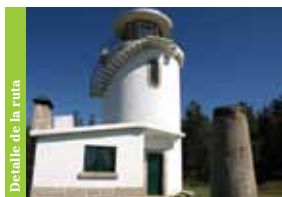
Detalle de la ruta