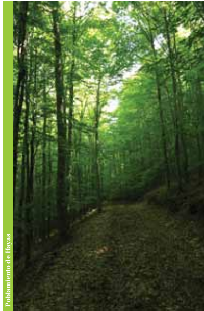
Plantamiento de Hayas