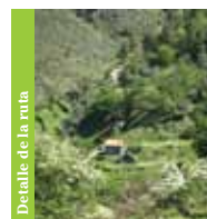
Detalle de la ruta