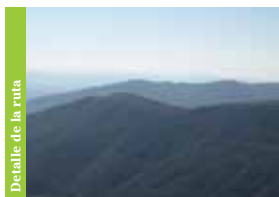
Detalle de la ruta

En el paisaje natural se destaca el Valle Glaciar del Zêzere , formando una “U”, la Torre , el Cântaro Magro , el Cântaro Gordo y las Peñas Doradas .