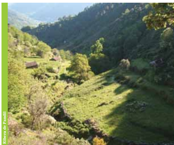
Ribera de Pandil

Los poblamientos forestales, los bosques y las líneas de agua presentes, ofrecen diversidad de fauna silvestre. De relieve la existencia de mamíferos como el zorro , la guarduña , la comadreja o el jabalí . En las aves, el cernícalo común , la lechuza y el cuervo . Los reptiles están representados por la víbora hocicuda , la lagartija colilarga o el lagarto ocelado .