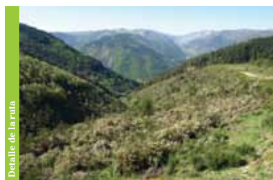
Detalle de la ruta