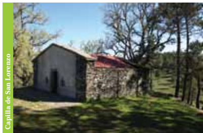
Capilla de San Lorenzo

Además de esta especie también hay que destacar el castaño , el escobón , el abeto de Douglas y los imponentes robles monumentales que rodean la Capilla de San Lorenzo , un lugar de culto de reminiscencias paganas, relacionado con el culto a los árboles y al sol – en el Solsticio de verano, que está en Manteigas puede observar la salida del sol sobre San Lorenzo .