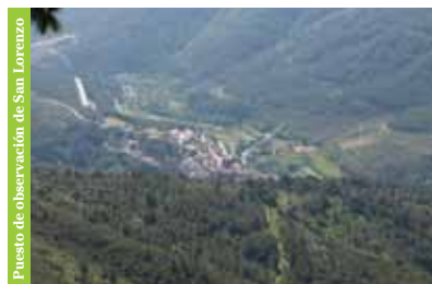
Puesto de observación de San Lorenzo