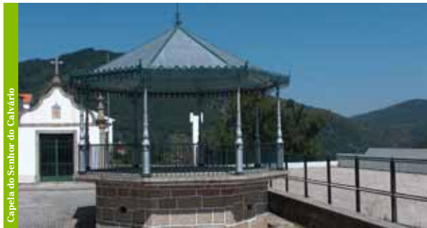
Capela do Senhor do Calvário

Juntamente com a Igreja de Santa Maria que se localiza na face posterior, a Capela do Senhor do Calvário impõe-se num vasto adro. Trata-se de uma capela de 1916, de planta quadrada e com um espaço interior único, onde se pode ver uma cobertura em tecto de madeira em masseira.