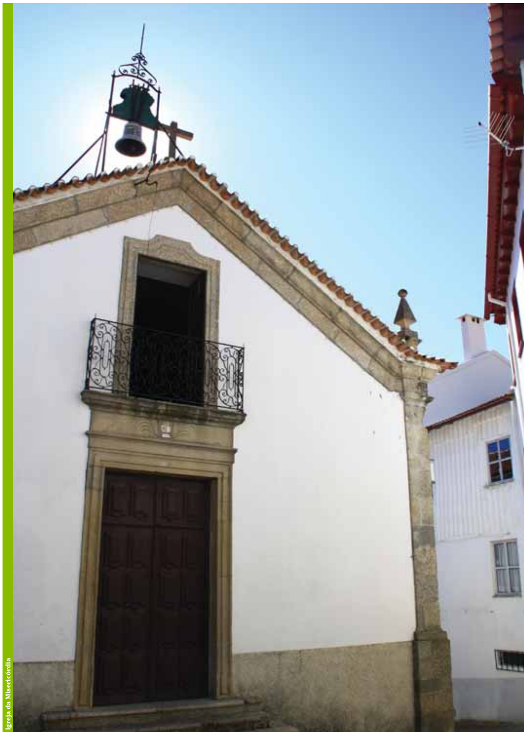
Igreja da Misericórdia