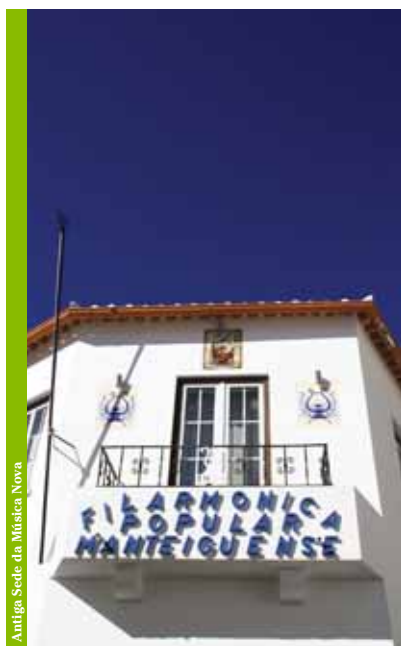
Antiga Sede da Música Nova

Os navegantes em gesto de reconhecimento ofereceram um lampanário de prata que se encontra suspenso no tecto do coro da Igreja de São Pedro de Manteigas.