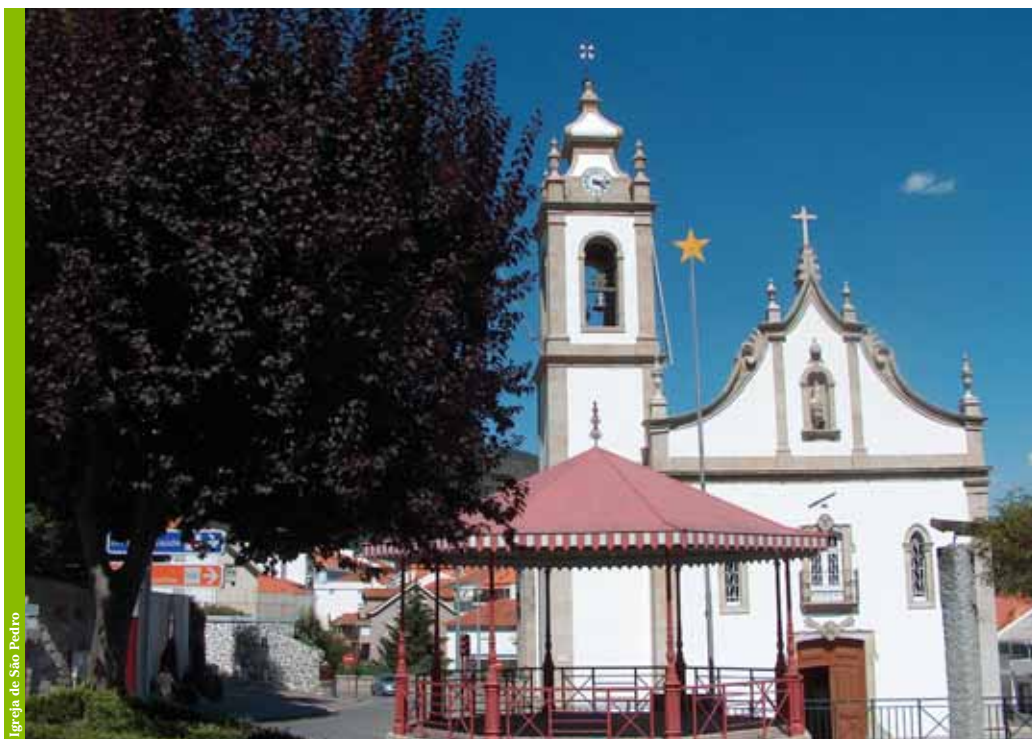
Igreja de São Pedro

A Igreja de São Pedro , por sua vez, é uma Igreja de construção novecentista com uma planta em cruz latina e capelas laterais. Outro dos símbolos religiosos da Vila são as Alminhas que se localizam na fachada de um dos edifícios da zona mais antiga da povoação. As Alminhas estão relacionadas com a crença no Purgatório, simbolizada por uma fogueira onde todas as almas têm que passar para serem purgadas com o fogo dos pecados veniais.