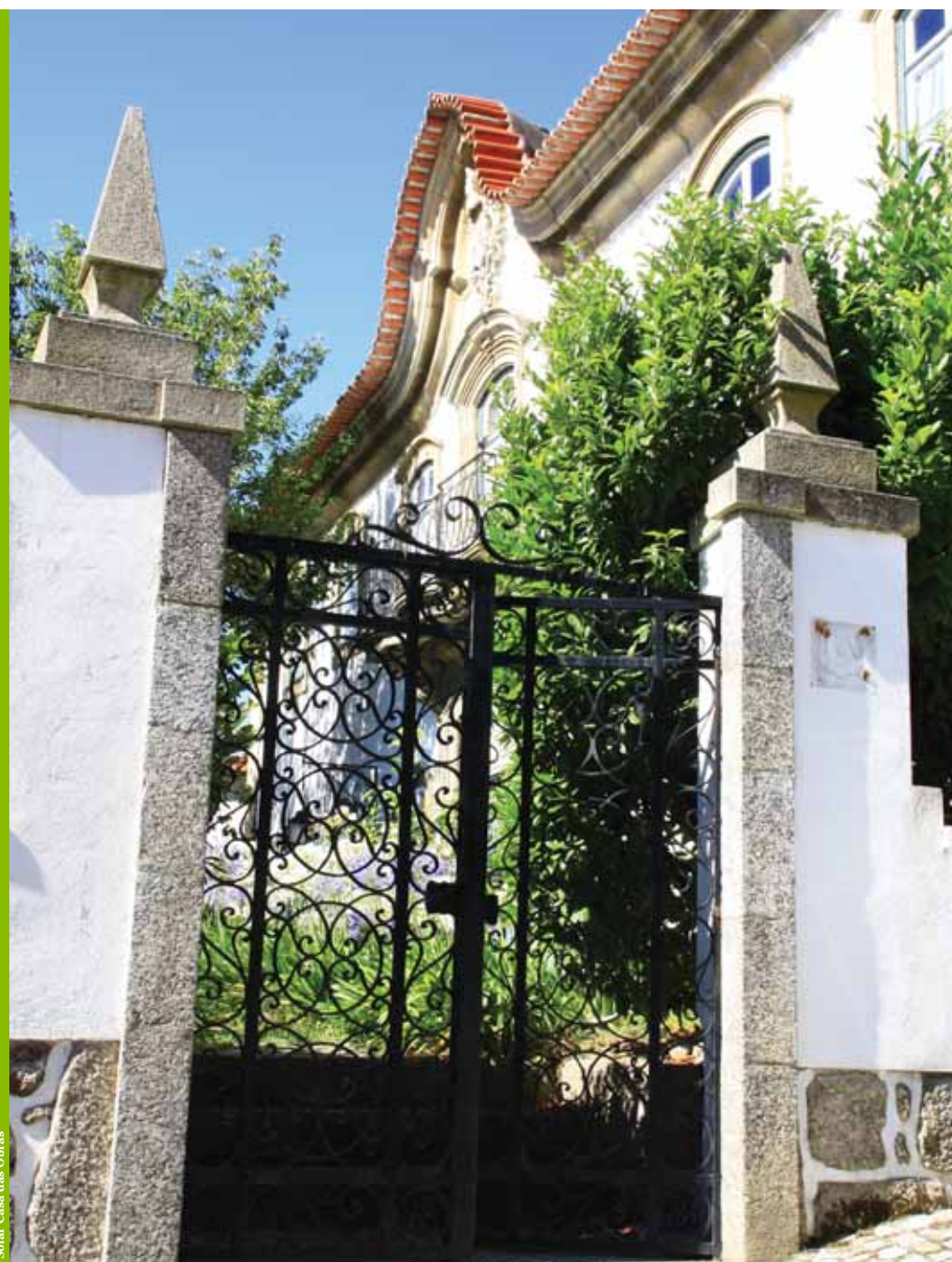
Solar Casa das Obras