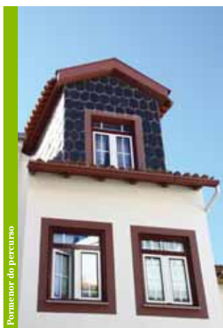
Pormenor do percurso