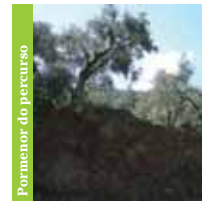
Pormenor do percurso