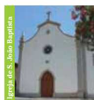
Igreja de S. João Baptista