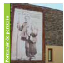
Pormenor do percurso