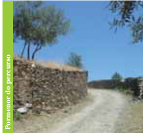
Pormenor do percurso

Ao longo da Rota de Sameiro salienta-se a vista panorâmica sobre os campos agrícolas, linhas de água que atravessam a povoação, locais de pastagem e a floresta que tudo envolve.