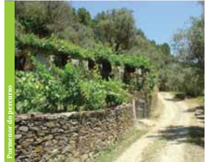
Pormenor do percurso

A Rota de Sameiro está, em grande parte, coberta por mosaicos de mato, prados abertos, cursos de água, áreas florestais, áreas agrícolas, fornecendo habitats ideais para diversas espécies, designadamente o licranço , andorinhão-preto , sapo-comum , boga-comum , corvo , cuco-canoro , ouriço-cacheiro , peneireiro , rela sardão , lagartixa-ibérica , lagartixa-do-mato , rã-ibérica , poupa , coruja-do-mato , coruja-das-torres , coelho bravo , entre outras. Merece especial destaque o morcego-de-ferradura-pequeno que enfrenta risco de extinção elevado.