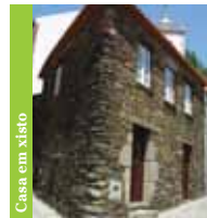
Casa em xisto