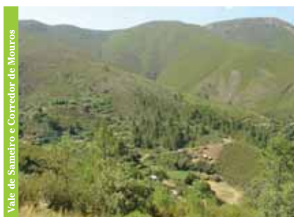
Vale de Sameiro e Corredor de Mouras